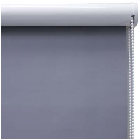
typ s kazetou